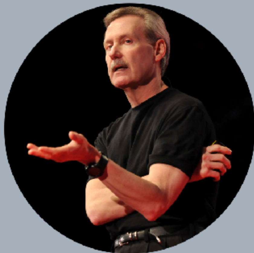
"The ONE Thing" , Gary Keller